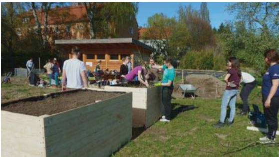
Studierende und MA im Hochschulgarten

Der Hochschulgarten RoSa soll künftigen (Biologie-) Lehrerinnen als Modell für einen möglichen Schulgarten dienen und mit den Kompetenzen ausrüsten, die für die Gestaltung und/oder Entwicklung künftiger Schulgärten notwendig sind. Auf einem Gebiet von ca. 400 m 2 entsteht seit dem Jahr 2011 in Kooperation mit den Mitarbeitenden des Botanischen Gartens ein Raum für kreative Forschung und Lehre in der Biologiedidaktik. Speziell für die Biologie-Lehramtsausbildung, die Umweltbildung und die Erwachsenenbildung werden Konzepte erarbeitet und teilweise bereits umgesetzt. Zusätzlich unterstützt der Schulgarten darin, Schülerinnen den Umgang und die Achtung vor der Natur beizubringen. ( www.biodidaktik.uni-rostock.de/rosa )