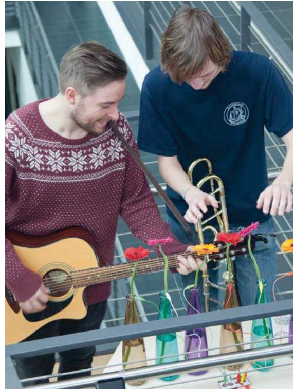
links: Experiment Physik des Segelns (Detail); rechts: Experiment Singende Blumen mit Studierenden

Im Lehr-Lern-Labor PhysSch wird Schülerinnen und Schülern, Lehrerinnen und Lehrern und insbesondere angehenden Lehrkräften die Möglichkeit gegeben, in spannenden und methodisch vielfältigen Lehr-Lern-Prozessen der Physik ganz nah zu kommen und einen guten Zugang zu wissenschaftlicher Tätigkeit zu finden. Fünf Labs ermöglichen die Erarbeitung physikalischer Themenkomplexe für alle Klassenstufen als gewinnbringende Ergänzung zum schulischen Unterricht aller Schulen. ( www.physik.uni-rostock.de/physch )